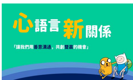
(附件 1 教學 PPT 節錄)